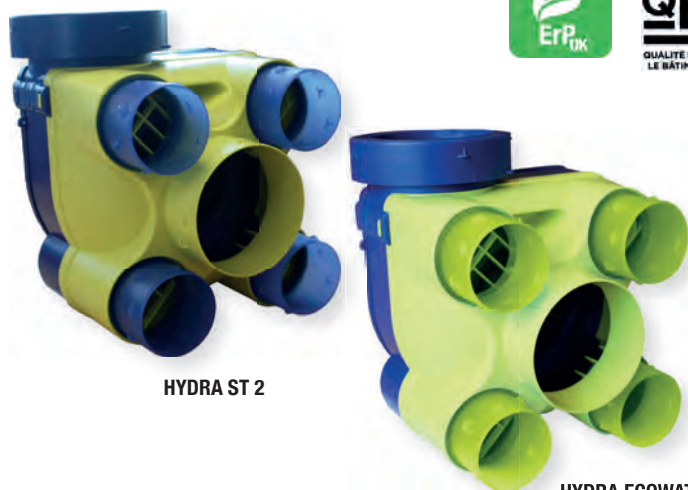
HYDRA ST 2