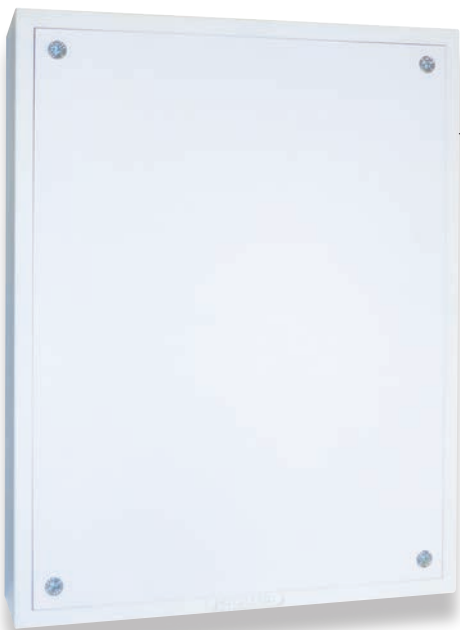
Tableau plastique démontable