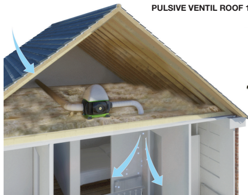
PULSIVE VENTIL ROOF 1S