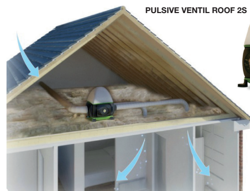
PULSIVE VENTIL ROOF 2S