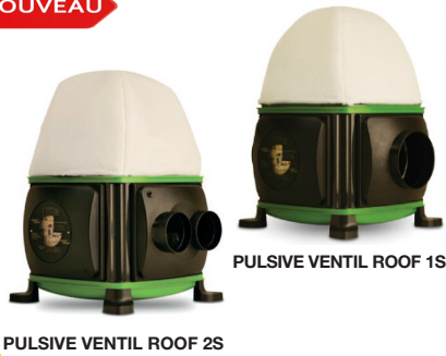
PULSIVE VENTIL ROOF 2S