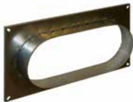
Virole oblongue pour clapet ISONE 2 rectangulaire

VIROLE OBLONGUE ISONE®2.1 645x265/700x300