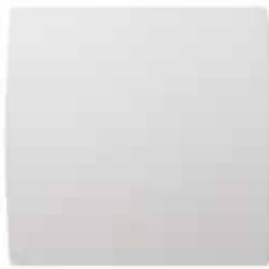
GRAPHIC vue de face