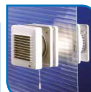
Spéciale vitre EDM 100 VM