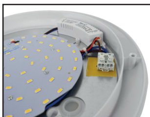
Connecteur rapide double entrée