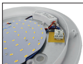
Connecteur rapide double entrées