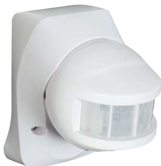
LUNA 101/150° et LUNA 101/180°