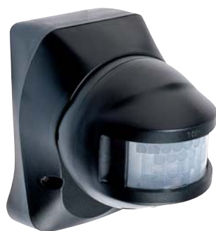
LUNA 101/150° et LUNA 101/180°

Réglage pour : LUNA 102/150L et 102/500L