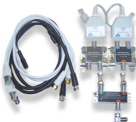
Kit câblo-opérateur Médiamix (Q 914)

Les kits câblo-opérateurs permettent de gérer la voie de retour sur les tableaux de communication Multibox et Médiamix.