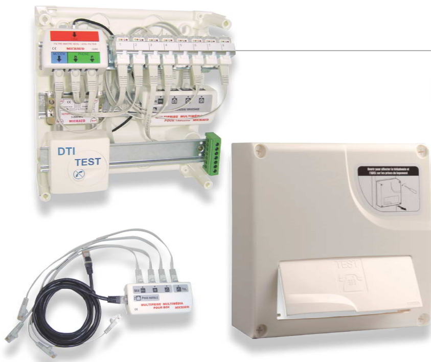
Tableau de communication DELTA Grd1 8 RJ45 box en ambiance (Q 219)

Mettez vos box en ambiance, dans votre salon par exemple, en renvoyant tous les signaux vers le tableau de communication !