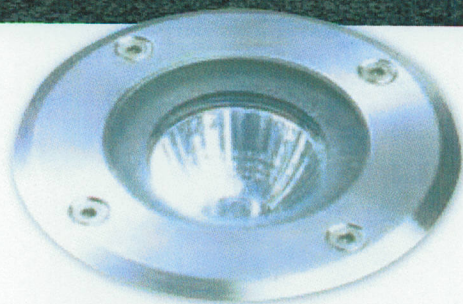
SAM ENS GU10 LED/5W