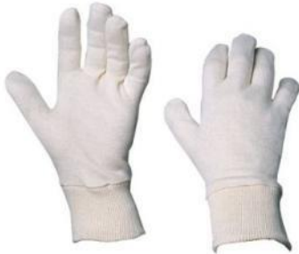
Sous-gants coton CG-80