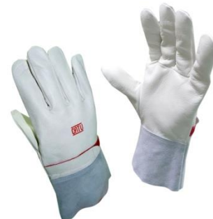
Sur-gants CG-981 pour classe 00 et 0