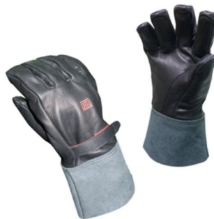
Sur-gants CG-991 pour classe 1 à 4