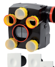
Kit KERIOS AUTOCOMUT Bouches design