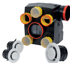
Kit KERIOS AUTOCOMUT Bouches classiques