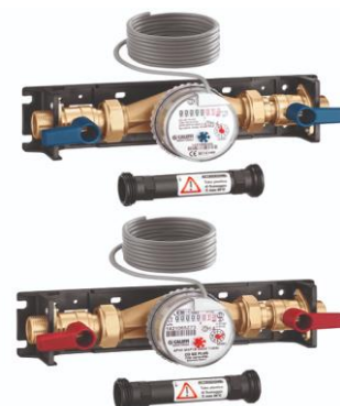
700051 - Eau chaude sanitaire

Compteur volumétrique pour eau sanitaire, conforme à la directive 2004/22/CE (MI001)