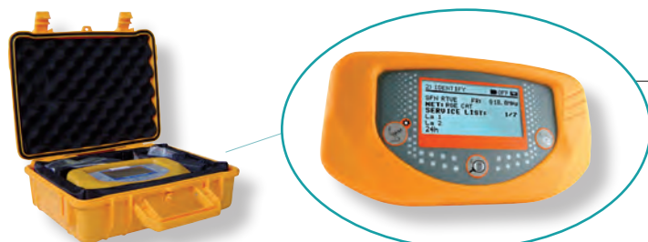
Pointeur - mesureur TV numérique (N 411)