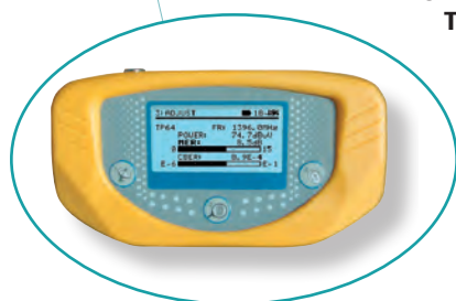
Pointeur - mesureur SAT numérique (N 412)